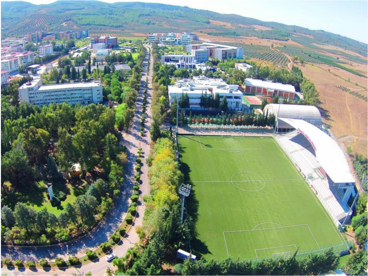
Resim 1: OKÜ Karacaoğlan Yerleşkesi

Üniversitemiz Karacaoğlan Yerleşkesinde Osmaniye Meslek Yüksekokulu ile beraber 2019 yılı sonu itibariyle 144.939,00 m 2 kapalı alan, ilçe kampüslerimizde ise 26.720,00 m 2 kapalı alan olmak üzere 171.659,00 m 2 toplam kapalı alana ulaşmıştır. Ayrıca 150.000 m 2 aktif yeşil alan ve otopark olarak kullanılmaktadır.