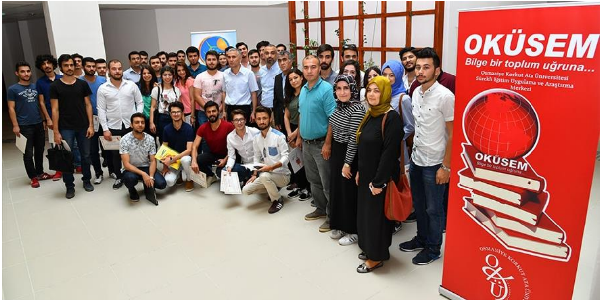
Resim 12: OKÜSEM Sertifika Töreni

OKÜSEM'in amacı; yaşam boyu eğitim-öğretimi desteklemek ve yaygınlaştırmaktır. Bu suretle OKÜSEM; üniversitenin örgün lisans ve lisansüstü programları dışında eğitim verdiği ve araştırma yaptığı tüm alanlarda eğitim, danışmanlık, proje, rehberlik ve psikolojik danışma hizmetleri vererek ve bunlarla ilgili yayınlar yaparak üniversitenin kamu, özel sektör ve uluslararası kuruluşlarla iş birliğinin gelişmesine katkıda bulunmayı hedeflemektedir.