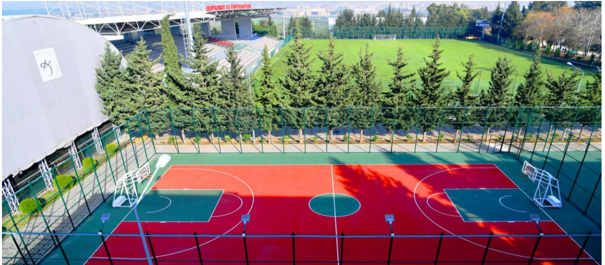
Resim 9: OKÜ Spor Kompleksi

Beden Eğitimi ve Spor Yüksekokulu, 06/12/2017 tarihinde Resmi Gazetede yayımlanan 30262 sayılı Bakanlar Kurulu Kararı ile kurulmuştur. Yapılandırma çalışmaları devam etmektedir.