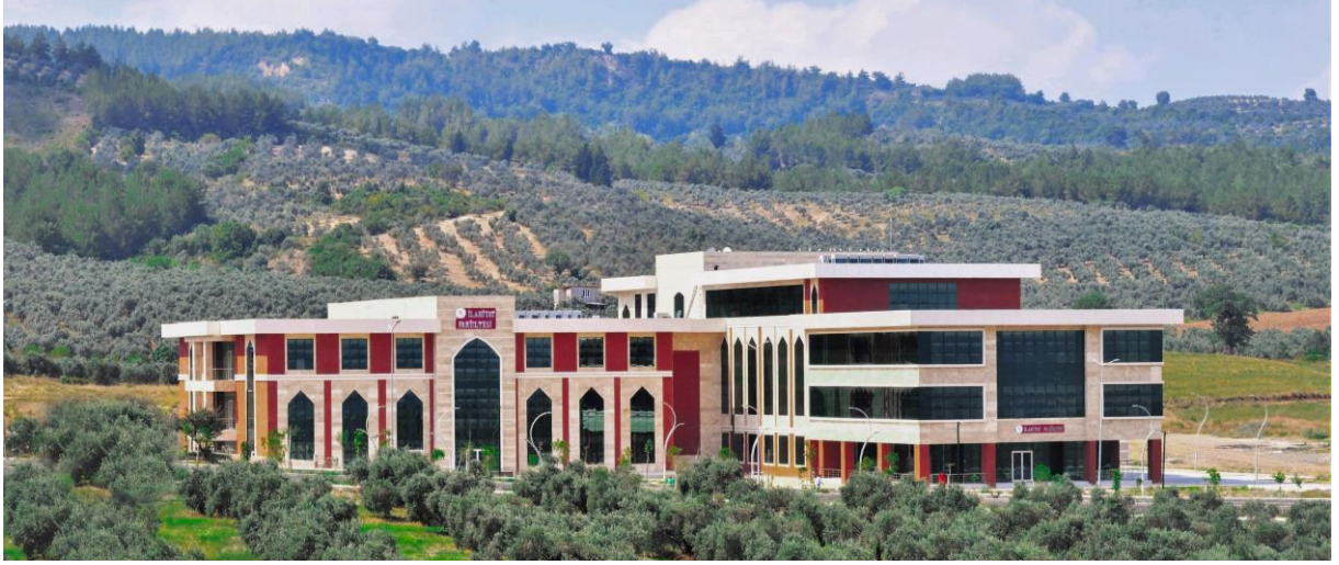
Resim 6: OKÜ İlahiyat Fakültesi

Osmaniye Korkut Ata Üniversitesi İlahiyat Fakültesi, 2015-2016 eğitim-öğretim yılında normal ve ikinci öğretim programlarına öğrencilerini kabul etmiştir. Din Bilimleri alanında eğitim vermek üzere bünyesinde Din Kültürü ve Ahlak Bilgisi Öğretmenliği, Felsefe ve Din Bilimleri, Temel İslami Bilimler, İslam Tarihi ve Sanatları Bölümleri açılmış bulunmaktadır.