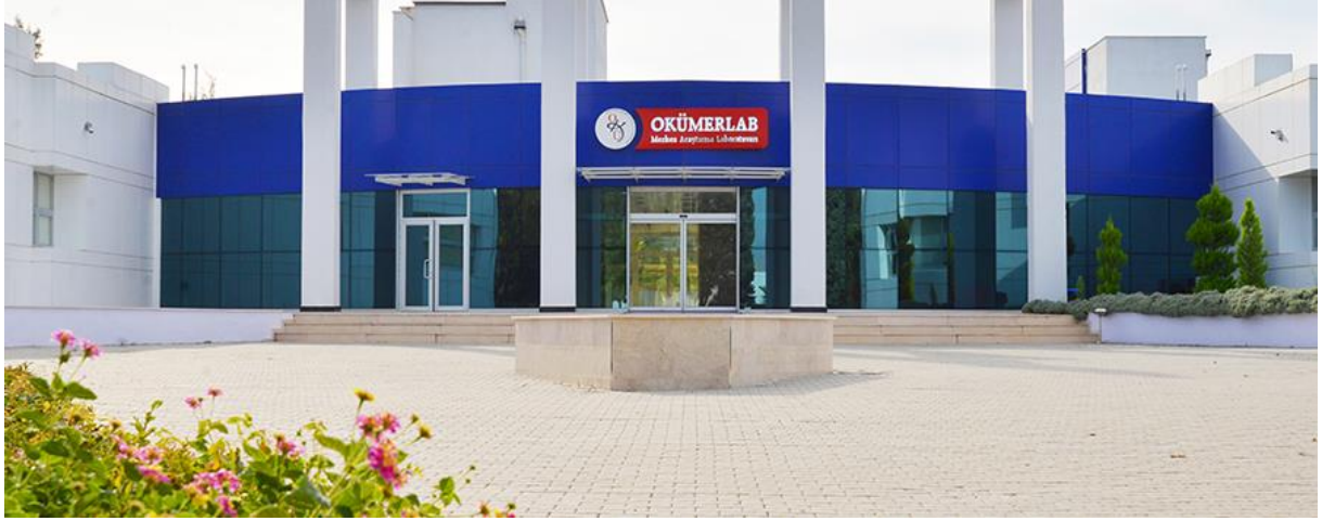
Resim 13: OKÜ Merkezi Araştırma Laboratuvarı

OKÜMERLAB Kimya Araştırma Laboratuvarı; İnorganik, Organik, Fizikokimya, Analitik ve Biyokimya Anabilim Dalı çalışmalarını içermektedir. Biyoloji Araştırma Laboratuvarı ise Botanik, Çevre, Mikrobiyoloji, Moleküler Biyoloji ve Zooloji Anabilim Dalı ile temel araştırmaları sürdürebilecek alt yapıya sahiptir.