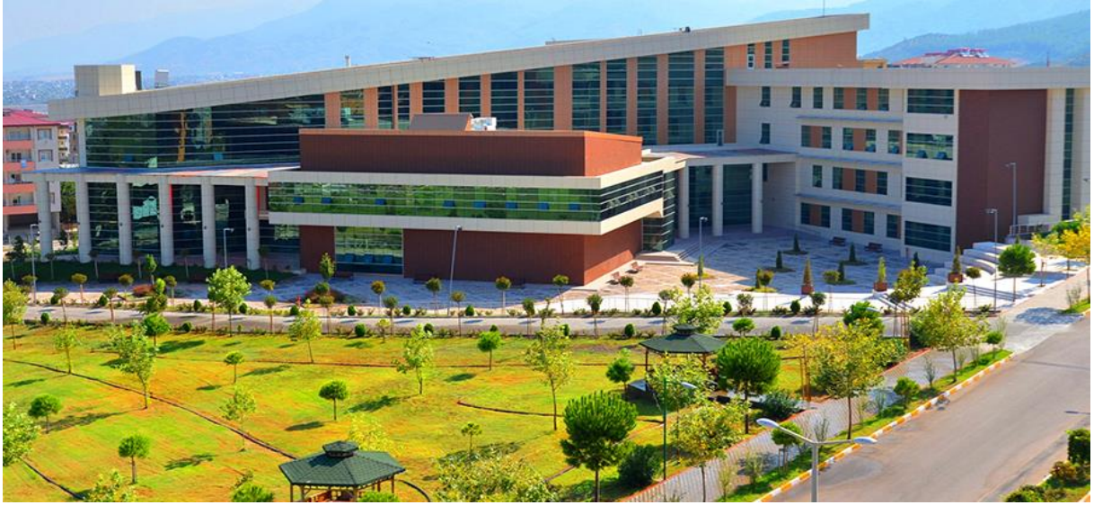
Resim 3: OKÜ İktisadi ve İdari Bilimler Fakültesi

Osmaniye Korkut Ata Üniversitesi İktisadi ve İdari Bilimler Fakültesi, 2009-2010 eğitim-öğretim yılında İşletme Bölümünün normal ve ikinci öğretim programlarına öğrenci almaya başlamıştır. 2011-2012 eğitim-öğretim yılında Yönetim Bilişim Sistemleri Bölümünün normal ve ikinci öğretim programlarına, 2013-2014 eğitim-öğretim yılında ise İktisat Bölümü normal öğretim programına öğrencilerini kabul etmiştir. 2014-2015 Siyaset Bilimi ve Kamu Yönetimi, 2015-2016 yılında da Uluslararası Ticaret ve Lojistik bölümleri normal ve ikinci öğretim programlarına ilk öğrencilerini almıştır. 2018-2019 eğitim-öğretim yılında Uluslararası İlişkiler normal öğretim programına öğrencilerini kabul etmiştir. Ekonometri ve Mâliye Bölümlerine öğrenci alabilmek için yoğun bir faaliyet sürdüren İktisadi ve İdari Bilimler Fakültesi, gerekli altyapı hazırlıklarını büyük ölçüde tamamlamış durumdadır.