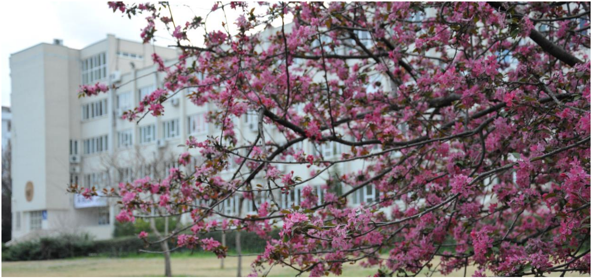
Resim 7: OKÜ Karacaoğlan Yerleşke Alanı

Fen Bilimleri Enstitüsü gerek bugünün gerekse geleceğin iş dünyası ihtiyaçlarını göz önünde bulundurarak, eğitim-öğretim programlarını geliştirmekte ve kaliteli eğitim-öğretim için gerekli her türlü koşulları öğrencilerine sunmaktadır.