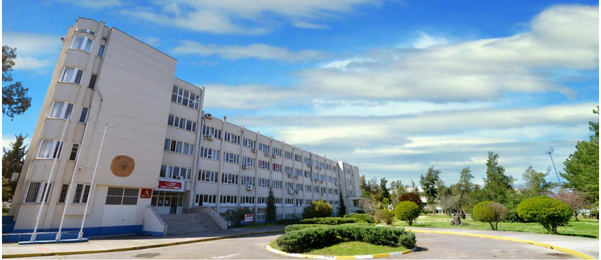
Resim 11: OKÜ Osmaniye Meslek Yüksekokulu

Osmaniye Korkut Ata Üniversitesi Osmaniye Meslek Yüksekokulu 40 yıllık geçmişiyle, her türlü gereksinime yanıt verecek şekilde hazırlanmış, derslik, atölye ve laboratuvar bakımından donanımlı fizikî altyapıya, güçlü ve tecrübeli akademik yapıya sahiptir. Osmaniye Meslek Yüksekokulunda; Yönetim ve Organizasyon Bölümü, Muhasebe ve Vergi Bölümü, Ulaştırma Hizmetleri Bölümü, Elektrik ve Enerji Bölümü, Bilgisayar Teknolojileri Bölümü, Çocuk Bakımı ve Gençlik Hizmetleri Bölümü, Çevre Koruma Teknolojileri Bölümü, Elektronik ve Otomasyon Bölümü, Mimarlık ve Şehir Planlama Bölümü, Motorlu Araçlar ve Ulaştırma Teknolojileri Bölümü, Makine ve Metal Teknolojisi Bölümü, El Sanatları Bölümü, İnşaat Bölümü, Tekstil, Giyim, Ayakkabı ve Deri Bölümü, Sağlık Bakım Hizmetleri Bölümü ve Yabancı Diller ve Kültürler Bölümü olmak üzere toplam 16 bölümde eğitim-öğretim hizmeti sunulmaktadır.