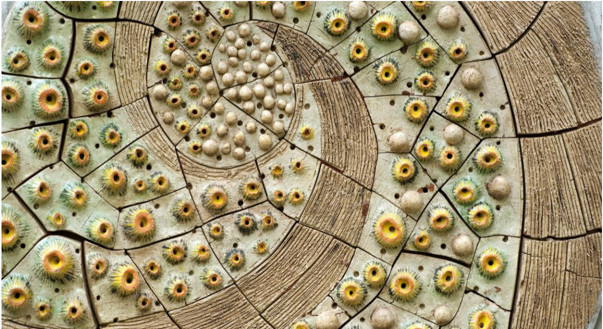
Resim 5: OKÜ Seramik Atölyesi Çalışmaları