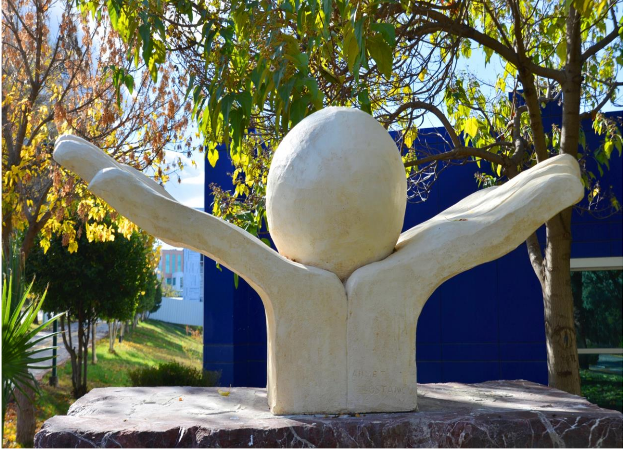
Resim 4: OKÜ Seramik Atölyesi Çalışmaları