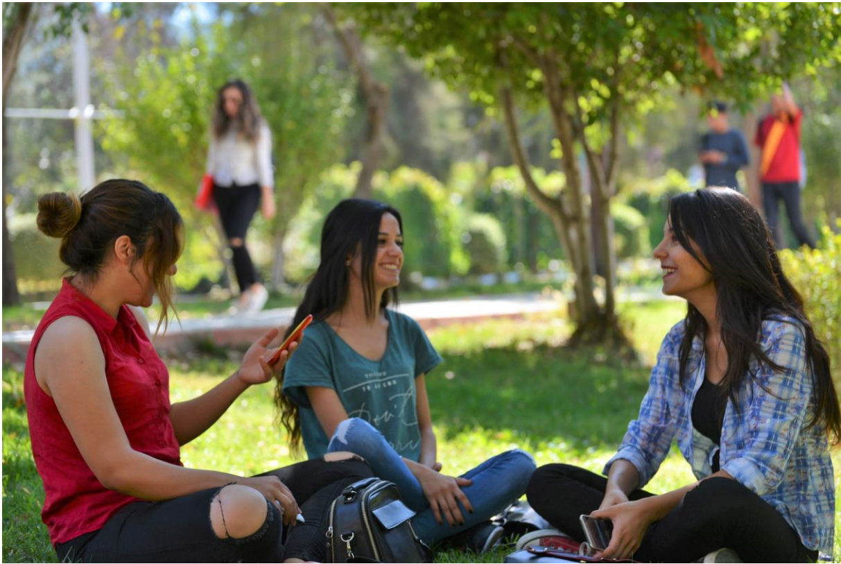
Resim 1: OKÜ Karacaoğlan Yerleşkesi

Üniversitemizin mevcut öğrenci sayıları birinci öğretim; 2975 ön lisans, 4314 lisans, 592 yüksekokul, 541 yüksek lisans ve doktora öğrencisi olmak üzere toplam 8422, ikinci öğretim; 1410 önlisans, 2699 lisans, 76 yüksek lisans olmak üzere toplam 4185 olup, genel toplam 12607 öğrencidir.