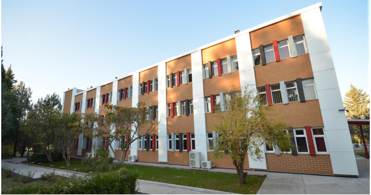
Resim 10: OKÜ Yabancı Diller Yüksekokulu

Osmaniye Korkut Ata Üniversitesi Kadirli Uygulamalı Bilimler Yüksekokulu bünyesinde Bankacılık ve Sigortacılık, Gastronomi ve Mutfak Sanatları, Spor Yönetimi, Turizm İşletmeciliği ve Otelcilik, Gıda Teknolojisi ve Organik Tarım İşletmeciliği Bölümleri kurulmuş olup 2014-2015 eğitim-öğretim yılında Gıda Teknolojisi ve Organik Tarım İşletmeciliği Bölümlerine, 2018-2019 eğitim-öğretim yılında ise Gastronomi ve Mutfak Sanatları Bölümüne öğrenci alımı gerçekleşmiştir. Diğer bölümlerde akademik altyapı çalışmaları devam etmektedir.