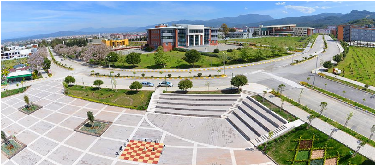
Resim 15: OKÜ Karacaoğlan Yerleşke

Resmi Gazetede yayımlanan 07.09.2008 tarih ve 26990 sayılı Osmaniye Korkut Ata Üniversitesi Döner Sermaye İşletmesi Yönetmeliği uyarınca, Üniversitemiz Yönetim Kurulunun 24.12.2009 tarih ve 2009/14/2 sayılı kararı ile Döner Sermaye İşletme Müdürlüğü faaliyetine başlamıştır. Döner Sermaye İşletme Müdürlüğünün faaliyet alanına giren iş ve hizmetler; Yükseköğretim kurumları dışındaki kamu kurum ve kuruluşları ile gerçek ve tüzel kişiler tarafından istenilecek bilimsel görüş, proje, araştırma ve benzeri hizmetlerde bulunmak, kurslar ve hizmet içi eğitim programları hazırlamak ve uygulamak, bilimsel sonuçların uygulanmasını sağlamak, her türlü danışmanlık, analiz, sentez, bakım onarım, iş değerlendirmesi ve organizasyonu yapmak, deneysel kuramsal raporlar ve bunlarla ilgili görüş ve öneriler sunmak, işletme hesapları ve fizibilite raporları hazırlamak, ihtisas laboratuvarları, araştırma merkezleri, atölye, arazi ve benzeri hizmet birimlerinde yapılacak tetkik, analiz, deney, bakım onarım, basım-yayım hizmetleri ve üretim ile ilgili iş ve hizmetleri yapmak, faaliyet alanları ile sınırlı olmak üzere mal ve hizmet üretiminde bulunmak, elde edilen ürünlerin değerlendirilmesini, tanıtılmasını ve pazarlamasını yapmaktır.