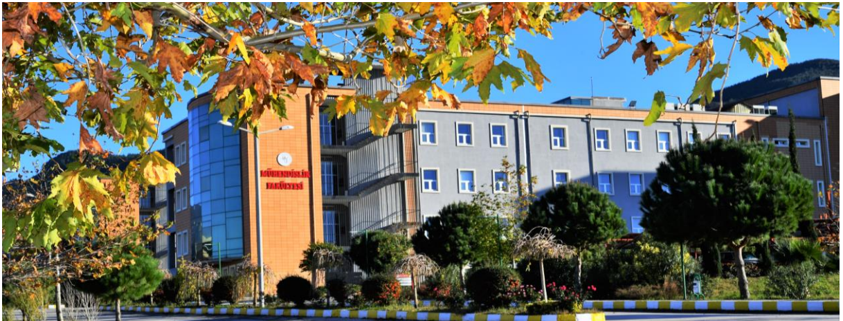
Resim 2: OKÜ Mühendislik Fakültesi

Osmaniye Korkut Ata Üniversitesi Mühendislik Fakültesi, 2009-2010 eğitim-öğretim yılında Enerji Sistemleri Mühendisliği Bölümüne normal ve ikinci öğretim olarak öğrenci almaya başlamıştır. Mühendislik Fakültesi, 2010-2011 eğitim-öğretim yılında Gıda Mühendisliği Bölümüne, 2011-2012 eğitim-öğretim yılında da, İnşaat, Makine, Elektrik-Elektronik Mühendisliği Bölümlerine, 2012-2013 eğitim-öğretim yılında Kimya Mühendisliği Bölümüne, 2016-2017 eğitim-öğretim yılında ise Harita Mühendisliği Bölümüne öğrenci almaya başlamıştır. Endüstri ile Bilgisayar Mühendisliği bölümlerine öğrenci alabilmek için yoğun bir faaliyet sürdüren Mühendislik Fakültesi, bu kapsamda gerekli altyapı hazırlıklarını büyük ölçüde tamamlamıştır.