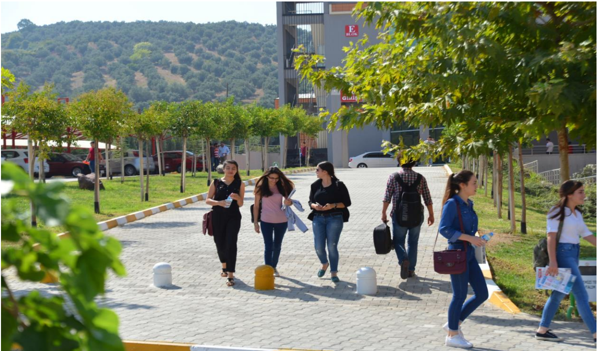
Resim 17: OKÜ Karacaoğlan Yerleşkesi