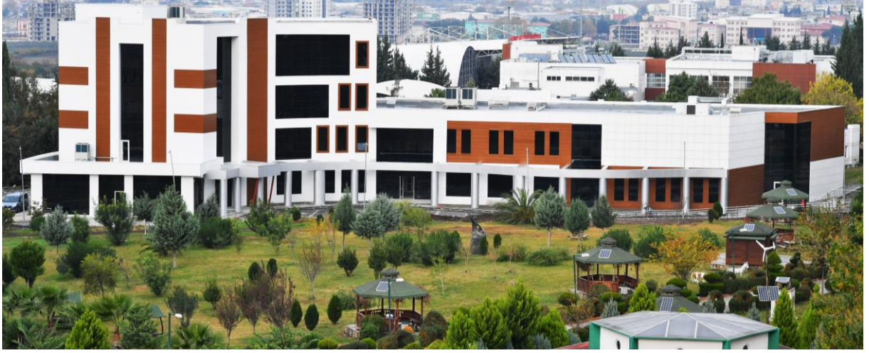
Resim 8: OKÜ Enstitüler Binası

Enstitümüz; öğrencilerine Osmaniye Korkut Ata Üniversitesinin şirin ve sıcak yerleşke ortamında genç, dinamik ve güçlü akademik kadrosu ile nitelikli araştırma ve çalışma ortamı sunmakta ve geleceğin başarılı akademisyenlerini ve iş hayatının her alanında hâlihazırda önemli sorumluluklar almış ve alacak insan kaynağını yetiştirmeye ve geliştirmeye çalışmaktadır.