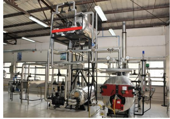
Resim 14: OKÜ ENERMER Laboratuvarları