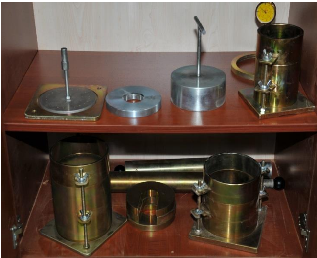
Kompaksiyon ve CBR Kalıpları