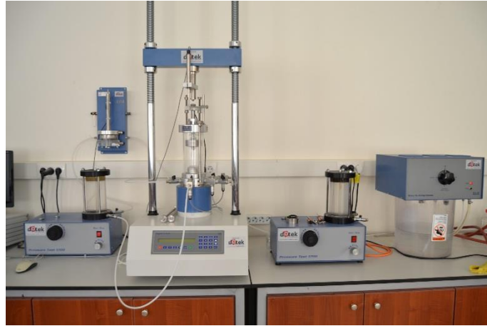
Üç Eksenli Basınç Deneş Düzeneđi