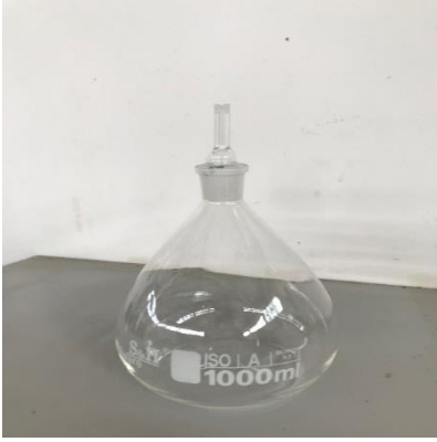
Dane Birim Hacim Ağırlık Deneyi (Piknometre Deneyi)