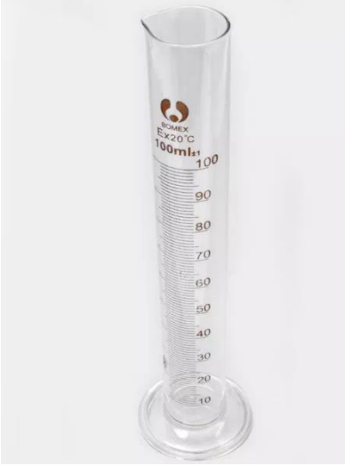
Mezür (Hidrometre Deneyi)