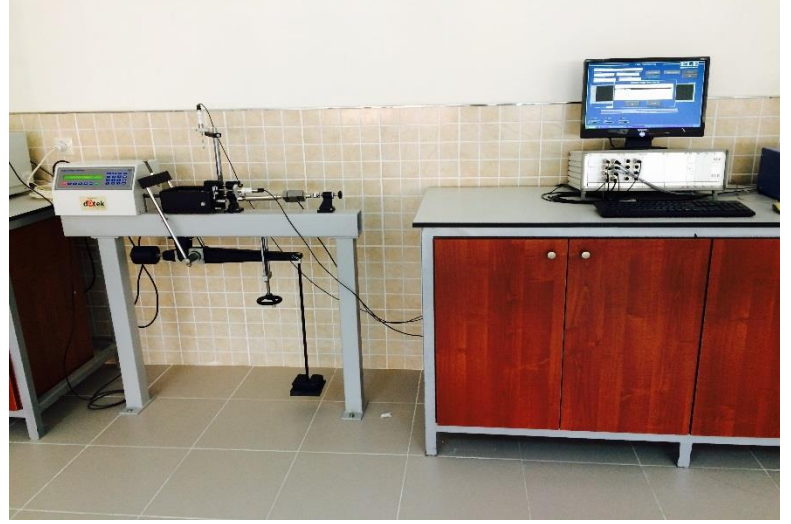
Kesme Kutusu Deney Düzeneği