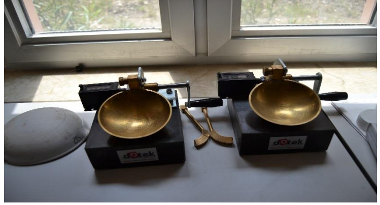
Casagrande Deney Aleti (Kıvam Limitleri Deneyi)