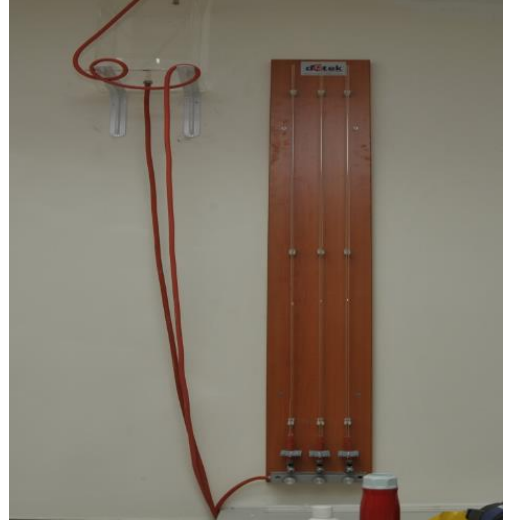
Permeabilite Deneş Düzeneđi